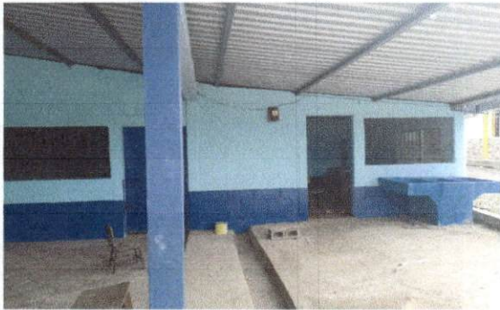
Foto 3: trabajo terminado en la pintura de muros de cocina, dirección y aula