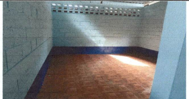
foto 6: Trabajo terminado en la instalación de pisos de aula y direccion

Observación: Si es necesario se pueden agregar hojas adicionales y actualizar el número de hojas.