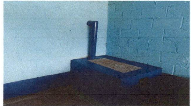
Foto 4: Trabajo terminado la salida de chimenea . Estufa completada